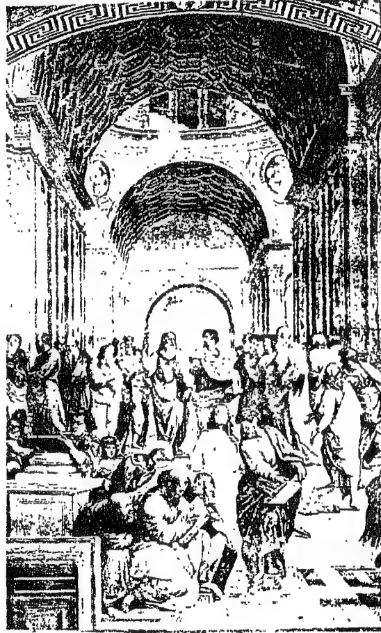
مدرسة أئينا (حيث يبدو ابن رشد) وإفيلوسانتر (1483 - 1520)